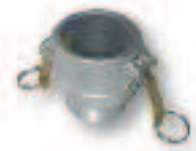
TYPE B - COUPLEUR - MALE - FILETE