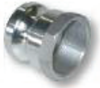
TYPE A - ADAPTEUR - FEMELLE - TARAUDE

Le raccord rapide pour une connexion sûre et rapide. Celui-ci se compose d'un Coupleur et d'un Adapteur qui peuvent coupler dans le même diamètre nominal. Les coupleurs sont équipés d'un système de verrouillage simple qui à l'aide de deux goupilles de sécurité bloque les leviers.